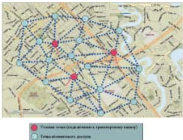
РИС. 2. Принципиальная схема размещения элементов Mesh-сети для организации абонентского доступа

абонентов, обеспечение круглосуточного электропитания и т.д.