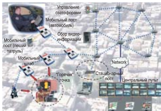
РИС. 3. Принципиальная схема организации муниципальной сети беспроводного доступа стандарта Wi-Fi

Анализ создания и развития Mesh-сетей показывает, что существует устой-